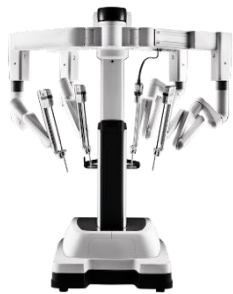
Système chirurgical da Vinci Xi

un chirurgien commence une procédure da Vinci.