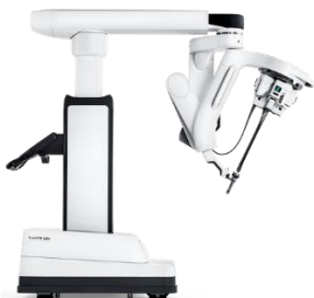
Système chirurgical da Vinci SP (single port) *