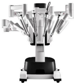
Système chirurgical da Vinci X