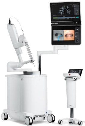
Ion endoluminal platform*

(Notes sur la formation : Intuitive facilite l'accès à la formation entre pairs et à la surveillance afin que les chirurgiens puissent poursuivre leur apprentissage chirurgical avancé. Les hôpitaux et les établissements chirurgicaux établissent et maintiennent leurs politiques concernant les privilèges accordés aux chirurgiens. Intuitive n'a pas le droit d'accorder ou de refuser des privilèges chirurgicaux, ni l'autorisation d'opérer.)